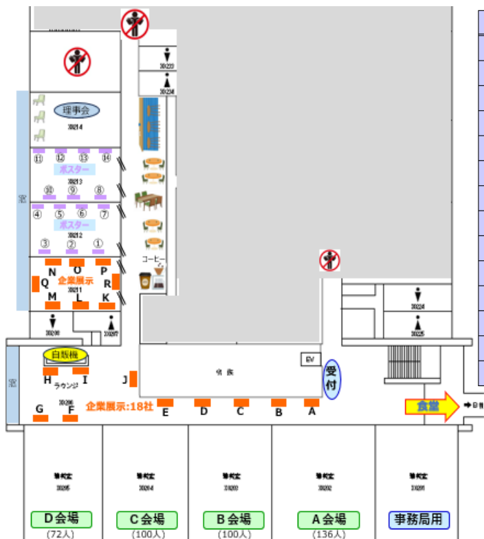
大同大学 X棟2階 レイアウト